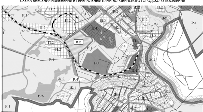
СХЕМА ВНЕСЕНИЯ ИЗМЕНЕНИЙ В ГЕНЕРАЛЬНЫЙ ПЛАН БОРОВИЧСКОГО ГОРОДСКОГО ПОСЕЛЕНИЯ

Приложение № 1 к постановлению Администрации муниципального района от 19.10.2017 № 3465